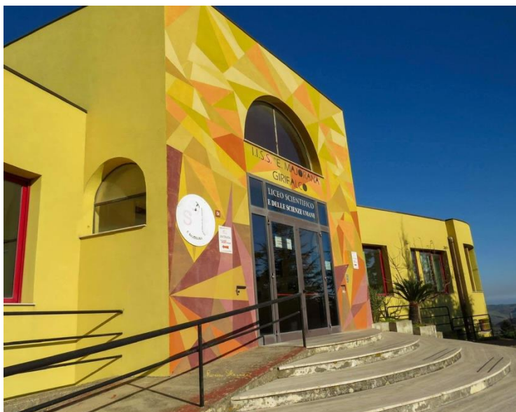
Figura 1: Istituto E. Majorana, sede del Liceo delle Scienze Umane

L'Istituto di Istruzione Superiore Secondaria "Ettore Majorana" deve il nome all'illustre fisico e matematico siciliano Ettore Majorana, allievo di Enrico Fermi, che sotto la sua guida, intraprese ricerche fondamentali sulla proprietà del nucleo atomico, giungendo a formulare una nuova teoria nucleare, e poi misteriosamente scomparso dalla scena pubblica nel pieno della sua fama.